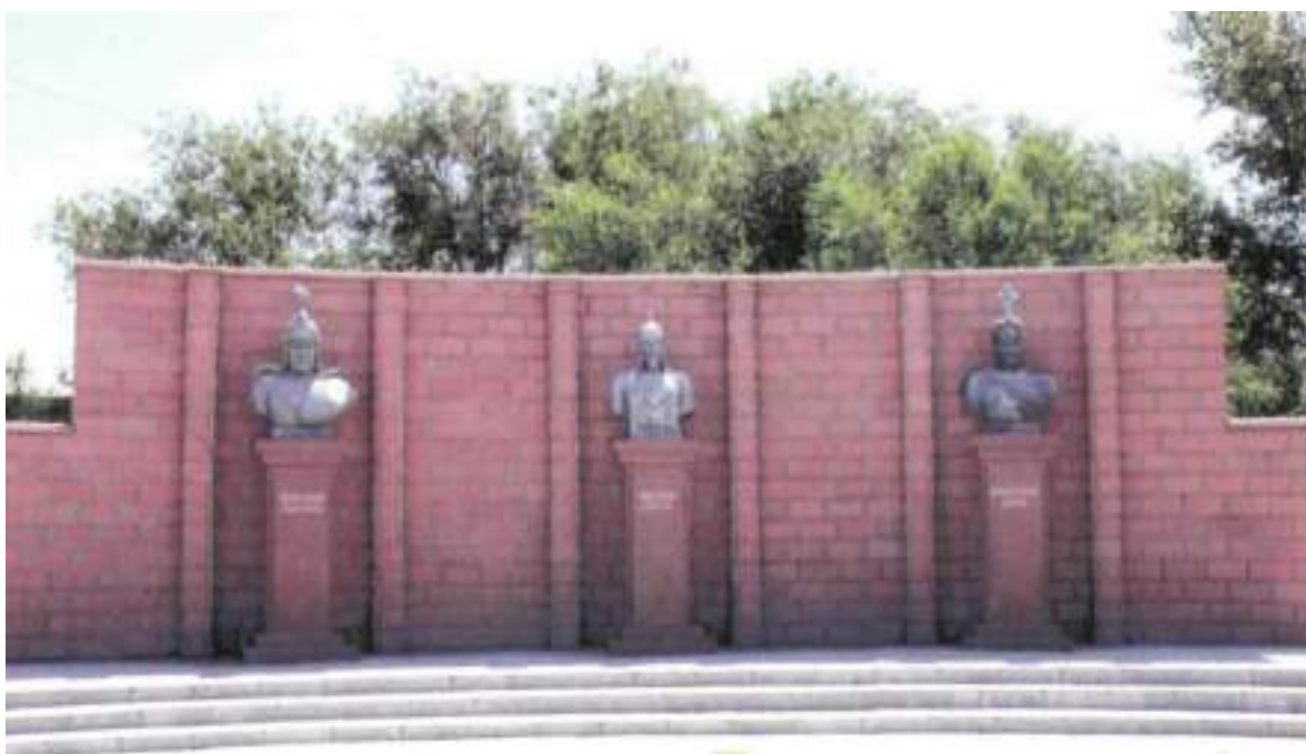
Аманкелді ауданында орнатылған батырлар мемориалы Жәуке батыр, Үдербайұлы Иман, сары Қошқар батыр