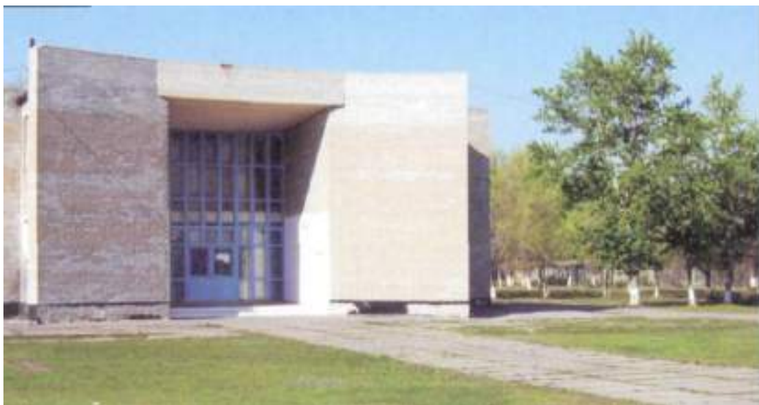
Халық батыры Амангелді Иманов атындағы мұражай 1969 жылы ашылды.