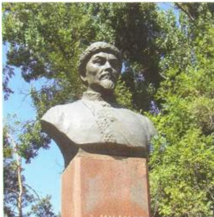
Амангелді Үдербайұлы Имановтың Алматы қаласындағы ескерткіші