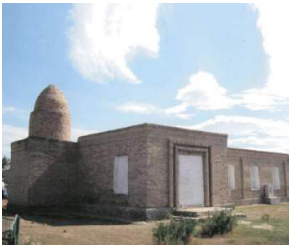
Амангелді ауданынан 13 шақырым қашықтықтағы Үрпек ауылында 1916 жылғы Торғай көтерілісшілерінің штад – квартирасы орналасқан