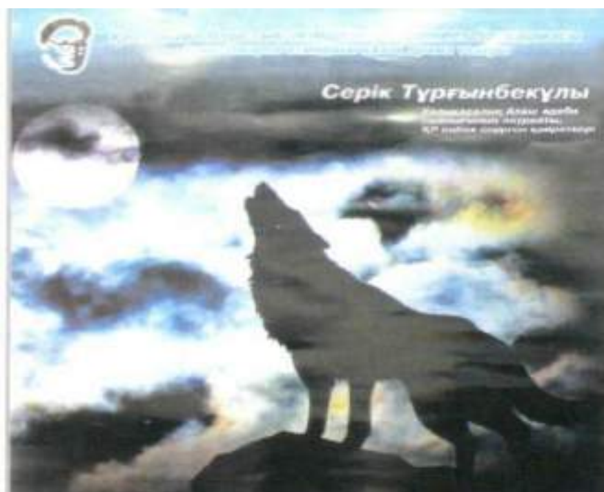
«Кейкі батыр» жайлы қойылымның жарнамасы. 2012 жылдың қарашасында Арқалық қаласында қойылым тұсаукесері өтті.