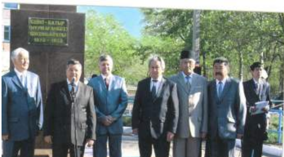
Арқалық қаласындағы Кейкі батырдың ескерткішін Қостанай облысының әкімі С. Кулагин ашты