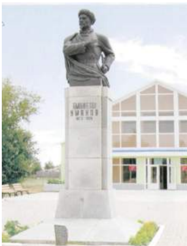
Торғай өлкесіндегі ұлт-азаттық көтерілістің қолбасшысы халық батыры Амангелді Үдербайұлы Имановқа ескерткіш Амангелді ауданы орталығында жастар демалыс алаңында орналасқан