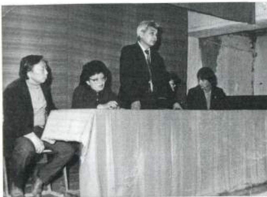
Арқалық муз. училищесі. 1985 г.