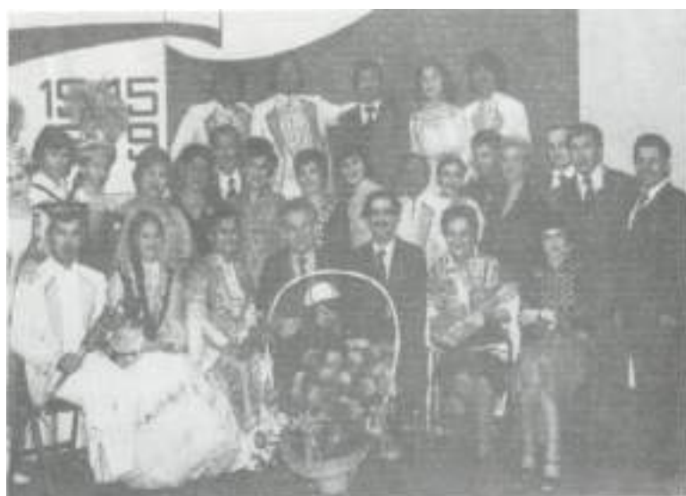
«Шертер» ансамблі Польша елінде.