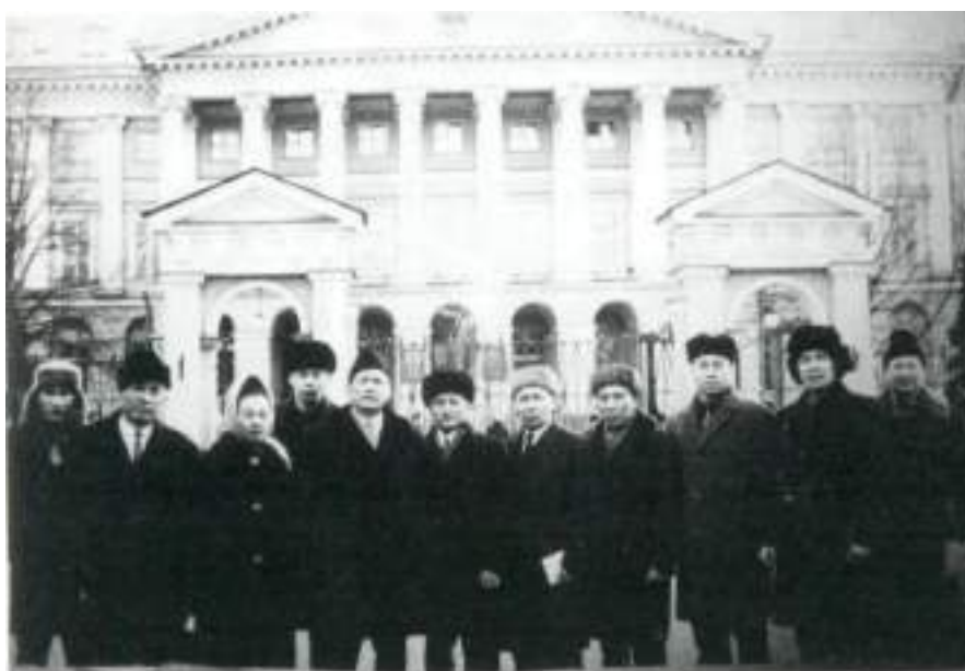
Төкен Сауытбайұлы Қостанай облысының делегациясының құрамында В.И. Ленин жүрген жолдармен саяхатта