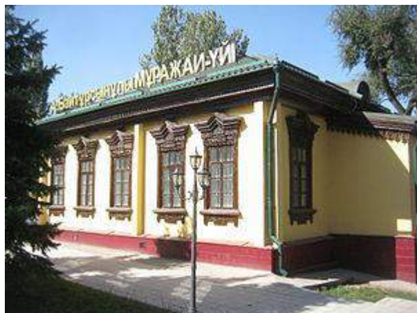
Ахмет Байтұрсынұлы Алматы мұражай-үйі, 1998

жерде тұрақты жұмысқа қабылданбай, түрлі мекемелерде қысқа мерзімдік қызметтер атқарады. 1937 жылы 8 тамызда тағы да қамауға алынып, екі айдан соң, яғни 8 желтоқсанда атылды.