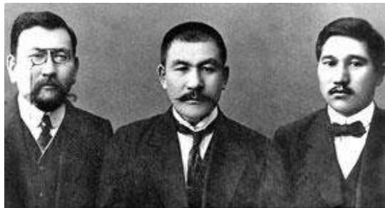
«Алаш» партиясының басшылары, 1917, Әлихан Нұрмұхамедұлы Бөкейхан, Міржақып Дулатұлы солдан оңға қарай: Ахмет Байтұрсынұлы, Әлихан Нұрмұхамедұлы Бөкейхан, Міржақып Дулатұлы

құрамына әуел бастан-ақ қазақтың ғылыми және шығармашылық зиялыларының белгілі өкілдері – М.Тынышбаев, М.Жұмабаев, Ш.Құдайбердиев, Ғ.Қарашев, С.Торайғыров, Х.Ғаббасов, Ә.Ермеков, Ж.Досмұхамедов, М.Дулатов, т.б. кірді.