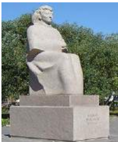
Қазақтың Ұлы ақыны Мағжан Жұмабайұлының ескерткіші