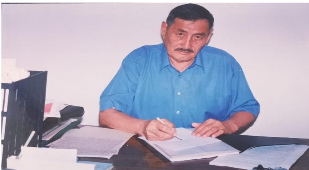
Хамит аға жұмыс үстінде