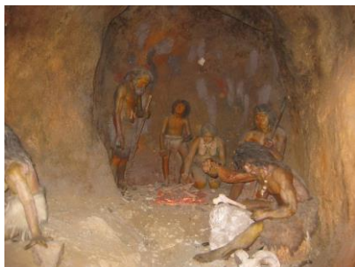
Алғашқы адамдардың тұрағы

Мұражайға келушілер адам өміріндегі ең алғашқы кезең палеолит дәуіріндегі алғашқы адамдар, Торғай даласының Тоқанай елді мекені жанынан табылған қосақтап жерленген ерлі–зайыпты адамдардың сүйегі, қола дәуіріндегі тіршілік, андронов мәдениеті жайында кеңінен мәлімет ала алады.