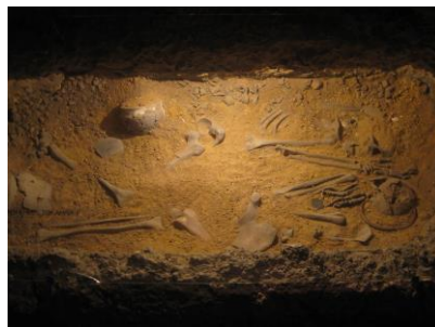
Қосақтап жерленген адам.