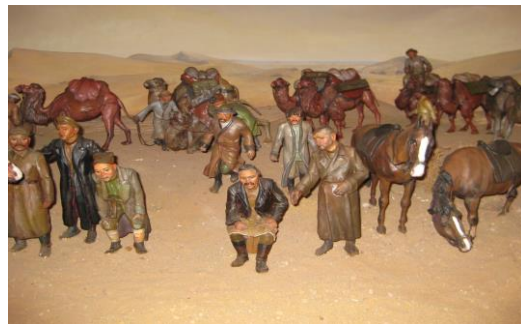
«Қызыл керуен» экспедициясы.