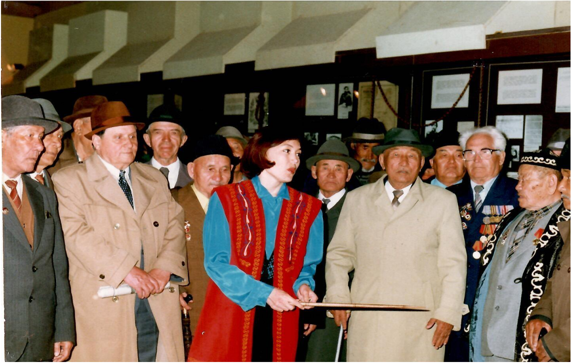
Ұлы Отан Соғыс ардагерлері мұражайда 1997 ж.