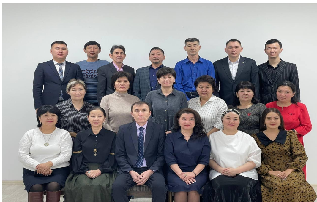
Мүражай ұжымы. 2022 ж.