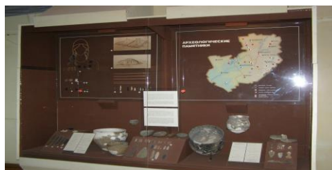
Арқалық ауданындағы Қожай елді мекенінен табылған Қожай коллекциясы.