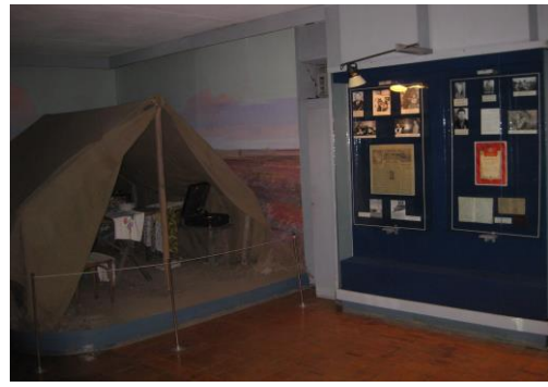
Тың игерушілерге арналған шатыр.

1918 жылы тамыз айында Кеңес үкіметі Қазақстанға оқ-дәрі, қару-жарак артқан экспедиция жіберді. Бұл экспедицияны Торғай өлкесінің сол кездегі төтенше соғыс комиссары Ә. Жангелдин басқарды.