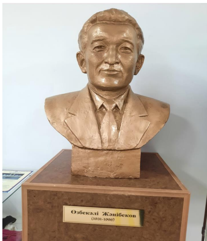
Ө. Жәнібековтың музейдегі кеуде мүсіні