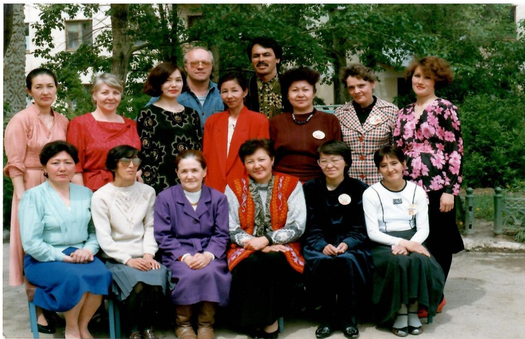
Мүражай ұжымы. 1997 ж.