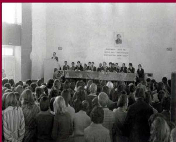
Мұражайдың ашылу салтанатына келген қонақтар