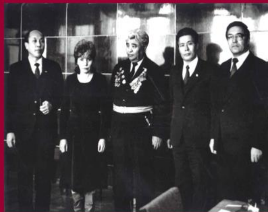
Ақын Ф. Оңғарсынова және Кеңес Одағының батыры, жазушы Қ. Қайсенов институт қонақтары