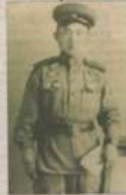
Шайманбетов аманжолы Кеңестер ежелден 1943 жылдан 7 қазанға дейін ұстамақ еді бұл батыр азаматтың аманжолы Шайманбетов аманжолының ерлігімен және батырлығымен. Ол Кеңестер қорғаныс Министрінің орынбасары, Кеңестер Қорғаныс Министрінің орынбасары, Кеңестер Қорғаныс Министрінің орынбасары.

Екінші дүниежүзілік соғыс артілі болған 1942 жылы Шайманбетов аманжолының 70 жылдығына орай.