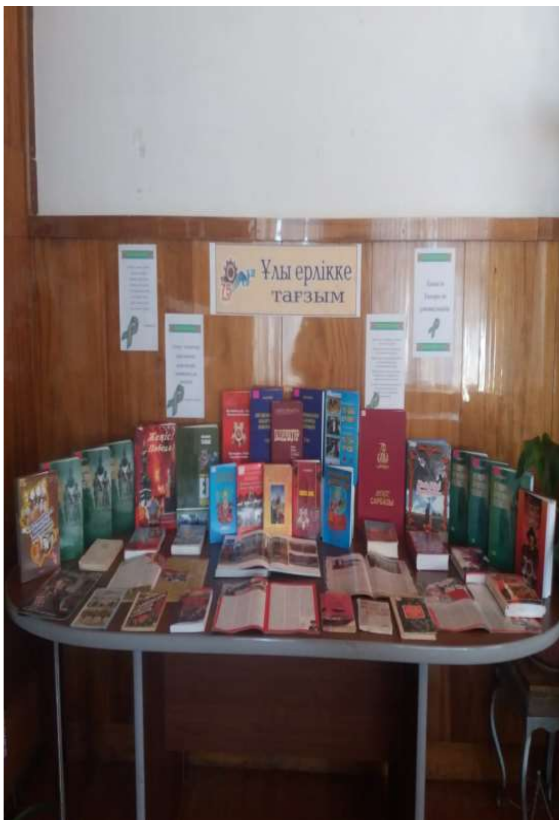
Ұлы Жеңістің 75 жылдығына орай ұйымдастырған оқу залының көрмесі