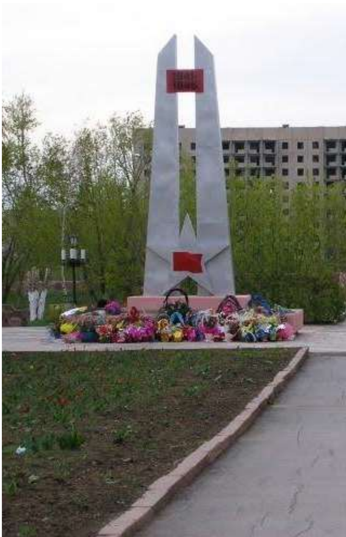
Арқалық қаласындағы Даңқ алаңы