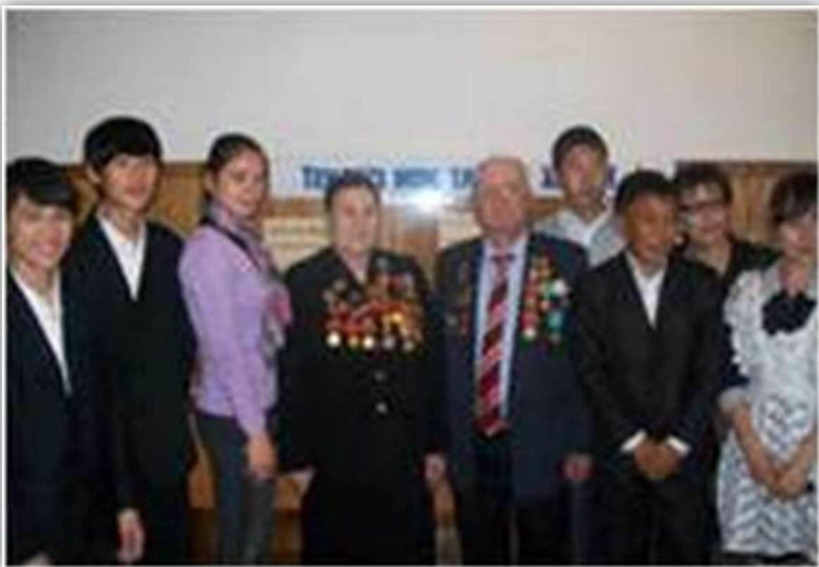
Ардагерлер оқушылармен бірге