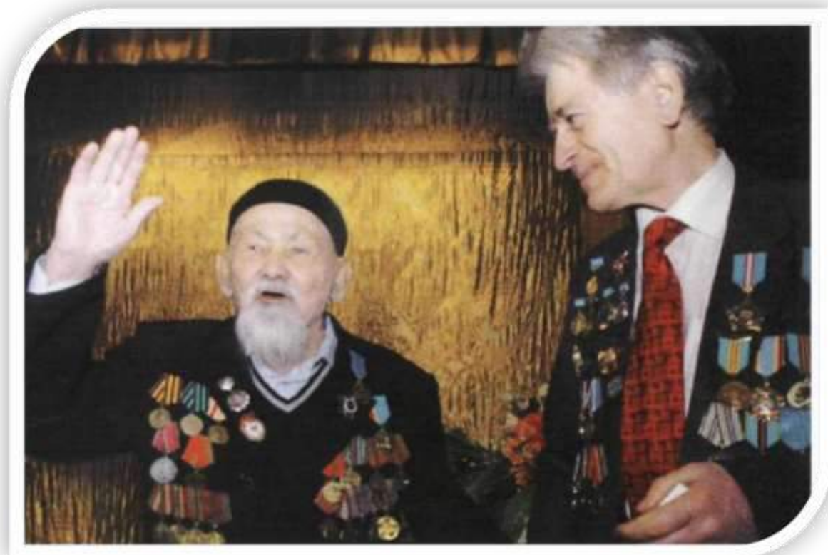
Ардагерлер бас қосқанда...