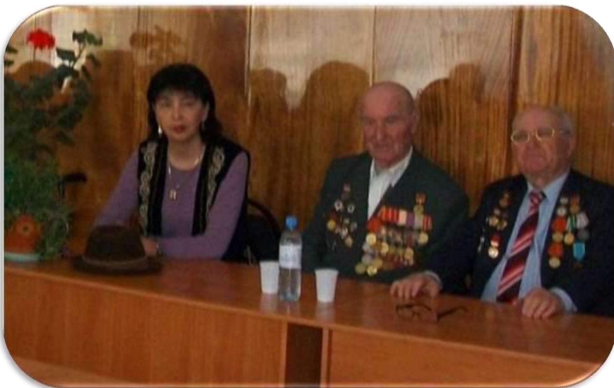
Кітапханадағы кездесуден көрініс