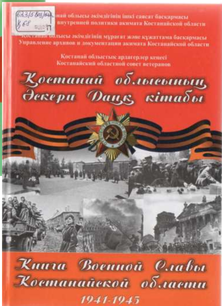
Ұлы Жеңіске зор үлес қосқан жерлестеріміздің есімдері енген кітаптар