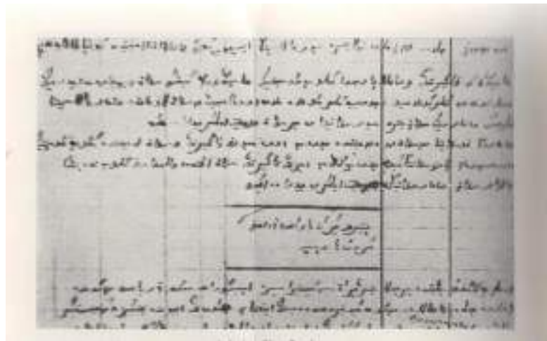
Аманкелді Имановтың күнделігінің бір беті.