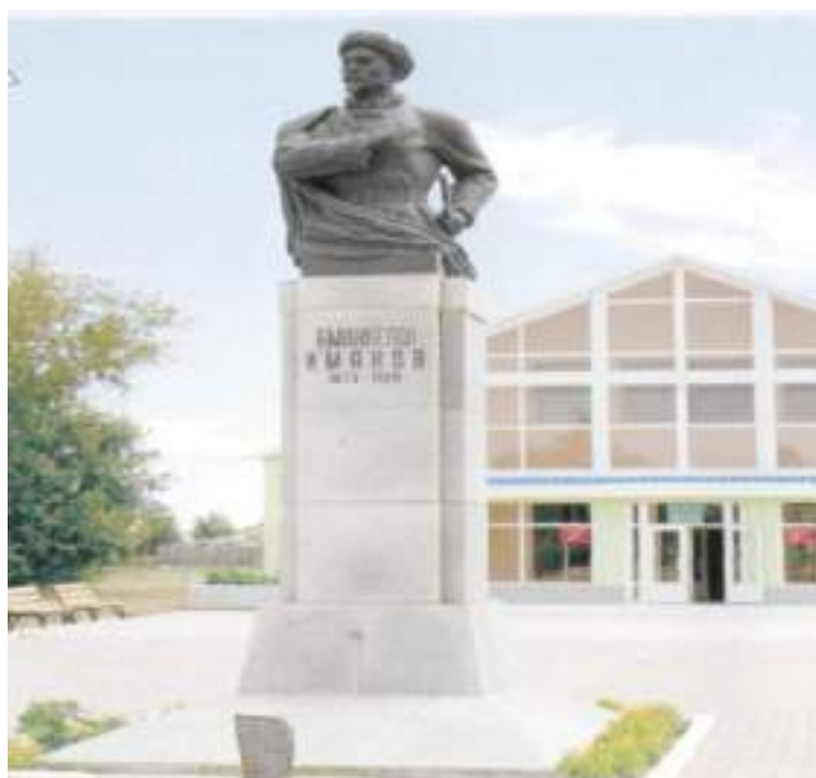
Торғай өлкесіндегі ұлт-азаттық көтерілістің қолбасшысы халық батыры Амангелді Үдербайұлы Имановқа ескерткіш Амангелді ауданы орталығында жастар демалыс алаңында орналасқан