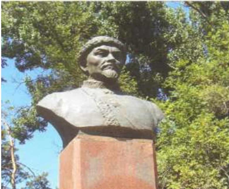
Амангелді Ұдербайұлы Имановтың Алматы қаласындағы ескерткіші