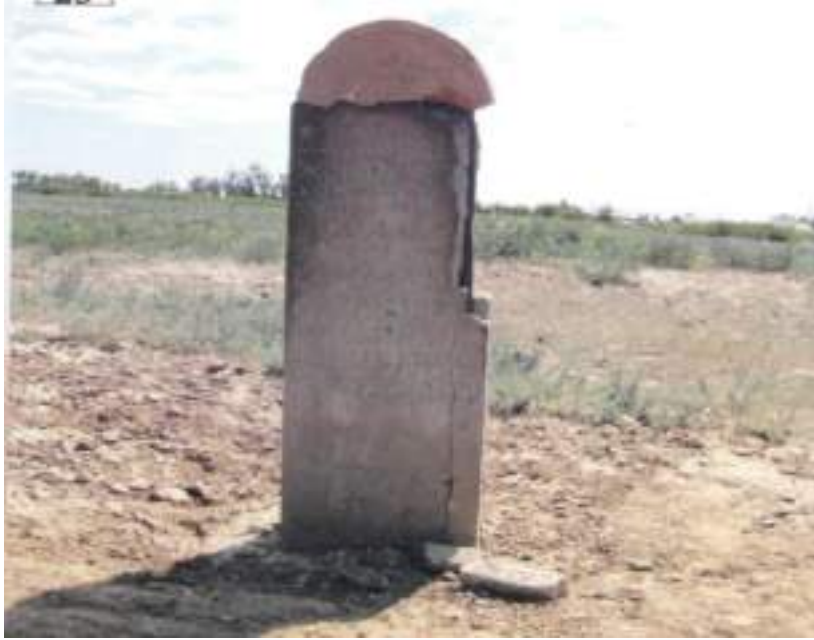
Амангелді ауданына қарасты Үрпек ауылы маңында 1916 жылғы ұлт-азаттық көтерілісшілерінің ұстаханасы орналасқан