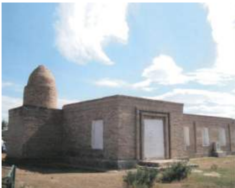
Амангелді ауданынан 13 шақырым қашықтықтағы Үрпек ауылында 1916 жылғы Торғай көтерілісшілерінің штаб квартирасы орналасқан