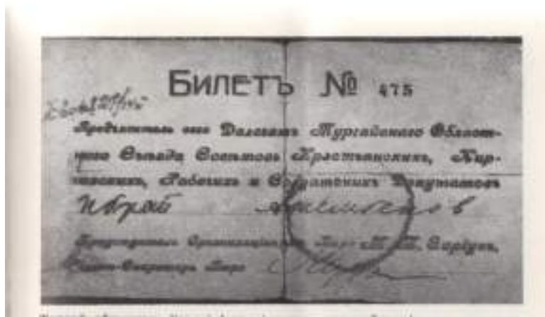
Торғай облыстық Советі 1-съезі делегатының билеті.