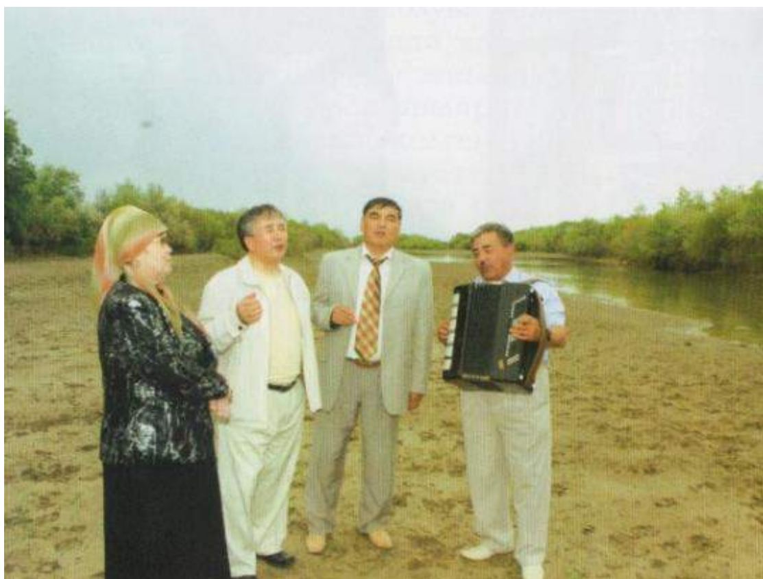
Шәмші әні шырқалғанда...