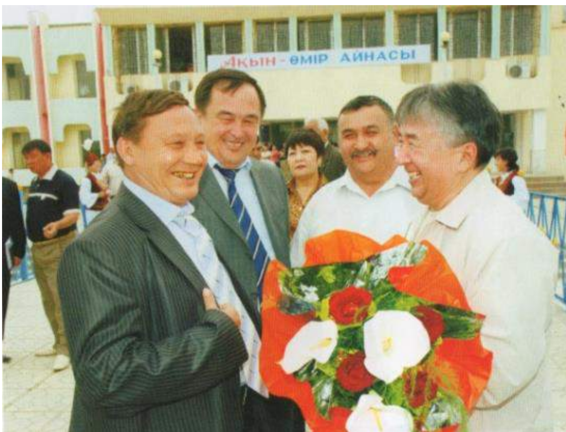
Шымкент жеріндегі шырайлы кездесу (2007 ж.)