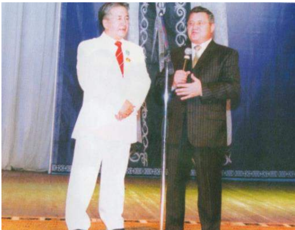
Қостанай облысының әкімі С.Кулагиннің құттықтауы (2005 ж.)