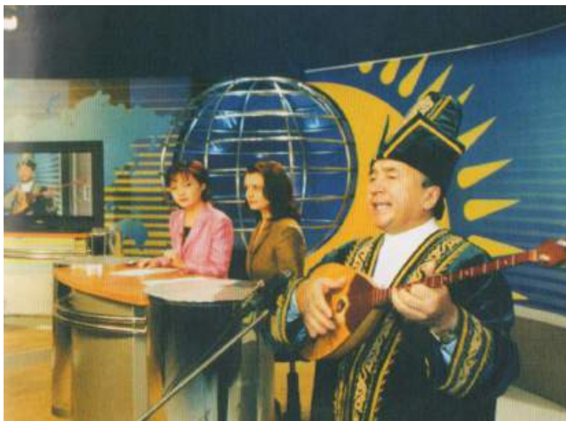
«Қазақстан» телеарнасының мерейтойы