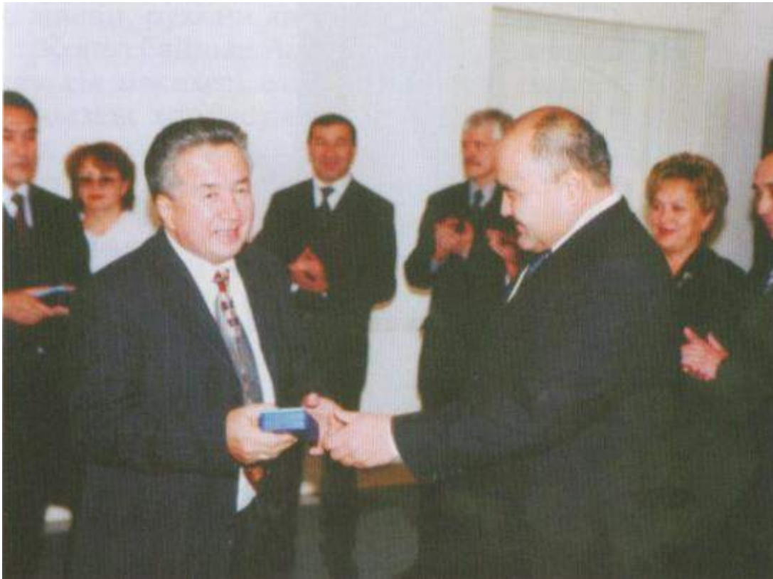
Астана қаласының әкімі Ө.Шөкеев «Парасат» орденін тапсырып тұр.(2004ж.)